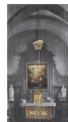
Un nouveau retable