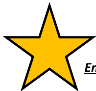
Enregistré sous N° : 002/LCSS