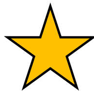
le : 31/12/2020