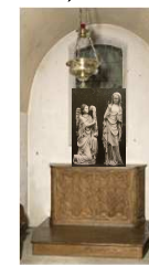
La chapelle de la Vierge de l'Annonciation