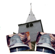
Le clocher avec ses 2 cloches